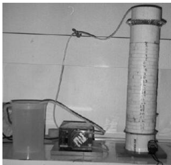
Fig. 2 Columna para experimentos de infiltración.

altura, ver Fig. 2. Se diseñó una ducha la cual fue colocada sobre la columna para alimentar un flujo de agua uniforme al material contenido dentro de la columna. Las columnas se empaclaron segmento por segmento, compactándose el material manualmente. Una bomba peristáltica y la ducha colocada sobre la columna proporcionan un flujo de agua a la columna. En los experimentos se usó material con distintas humedades iniciales, variando el flujo de agua y el tiempo de duración del experimento. Mediante ensayos preliminares se estimaron los tiempos máximos que podían durar los experimentos, sin que el agua se infiltrara hasta el fondo de la columna. Con esta información el experimento fue interrumpido y se tomaron los segmentos de dos en dos para determinar el contenido de humedad a lo largo de la altura de la columna. Durante la realización de los experimentos se mantuvieron la temperatura y el flujo constante (Hultberg y Wahlund, 1997).