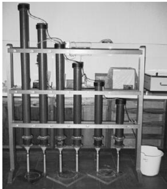
Fig. 1 Equipo para determinar permeabilidad.

cilíndrico con las dimensiones siguientes: 0.084 m de diámetro y 0.05 m de altura. Las pastillas provenientes del molde se empaclaron en las columnas.